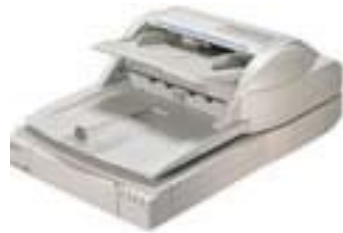
スキャナーで図面などをスキャニング