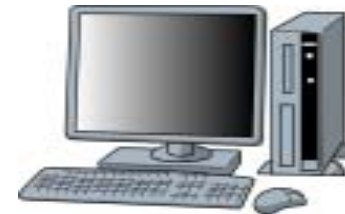
パソコンに入力してデータ管理